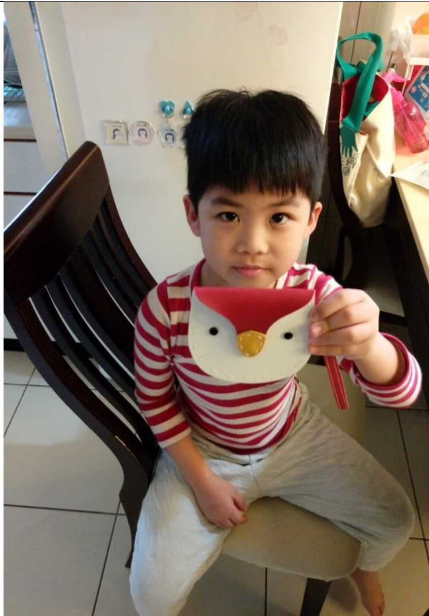
完工!小朋友的零錢包完成,很開心的說要裝錢買東西喔~