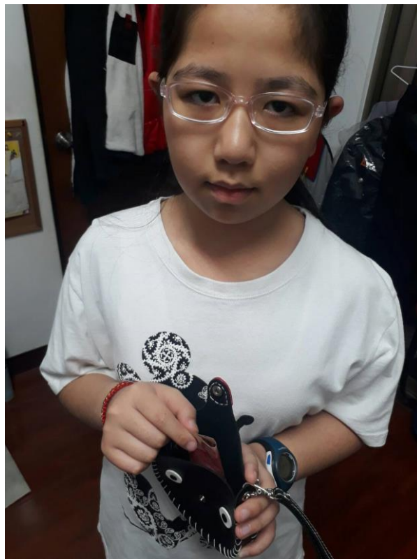
可以放入鈔票跟零錢喔