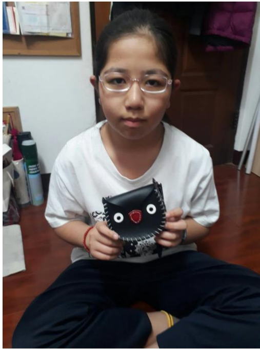
可愛的企鵝零錢包完成囉!!