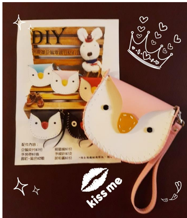
喔對了.....我是企鵝寶貝，不素貓頭鷹唷！