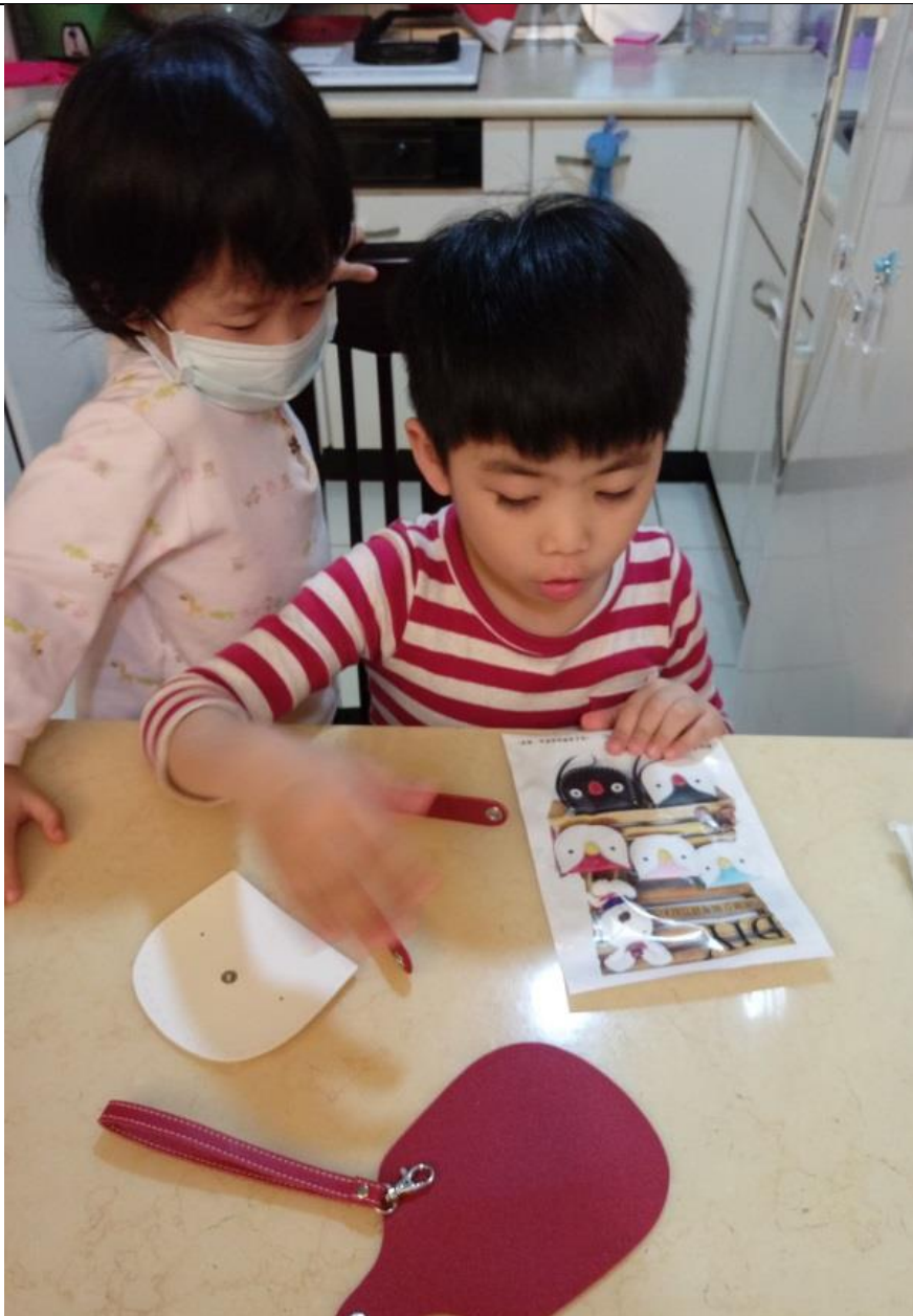
先依配件研究一番~