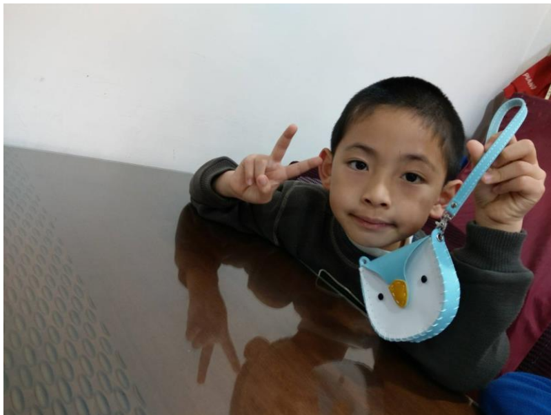
大功告成，但馬上被妹妹搶走了!!(妹妹愛藍色)