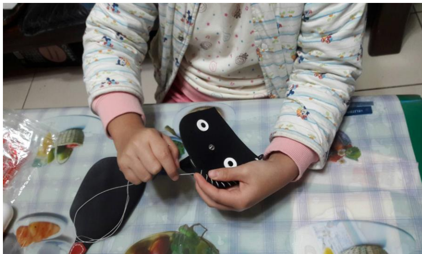
一針一線要拉好才會漂亮~