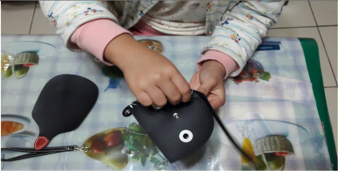
眼睛鼻子完成了，開始縫臉囉！