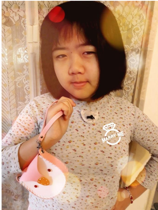
經過千辛萬苦的縫製， 終於完成口愛的粉紅仿皮貓頭鷹零錢包喔！