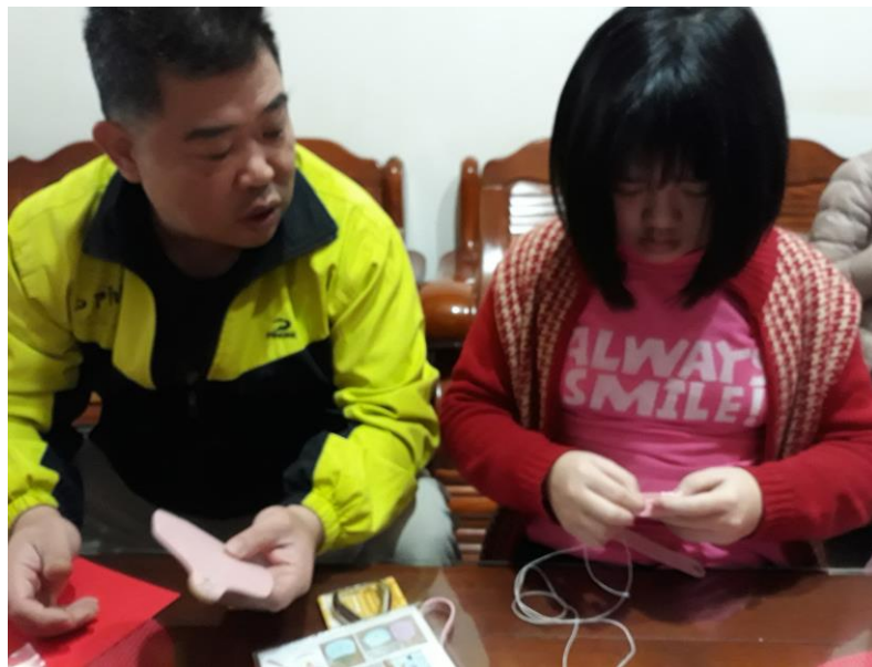
今天姐姐心血來潮來做貓頭鷹皮包 連爸爸也來參一腳哩!