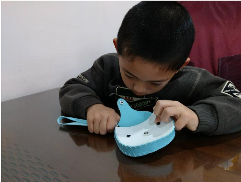
媽媽不放心我拿針，我來扣釦子好ㄛ!