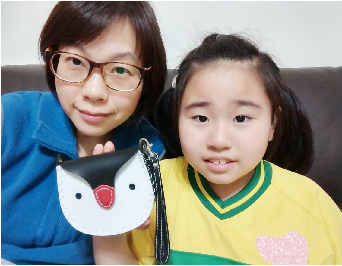
看我完成了企鵝零錢包 可以裝我的零用錢喔 超級可愛的企鵝