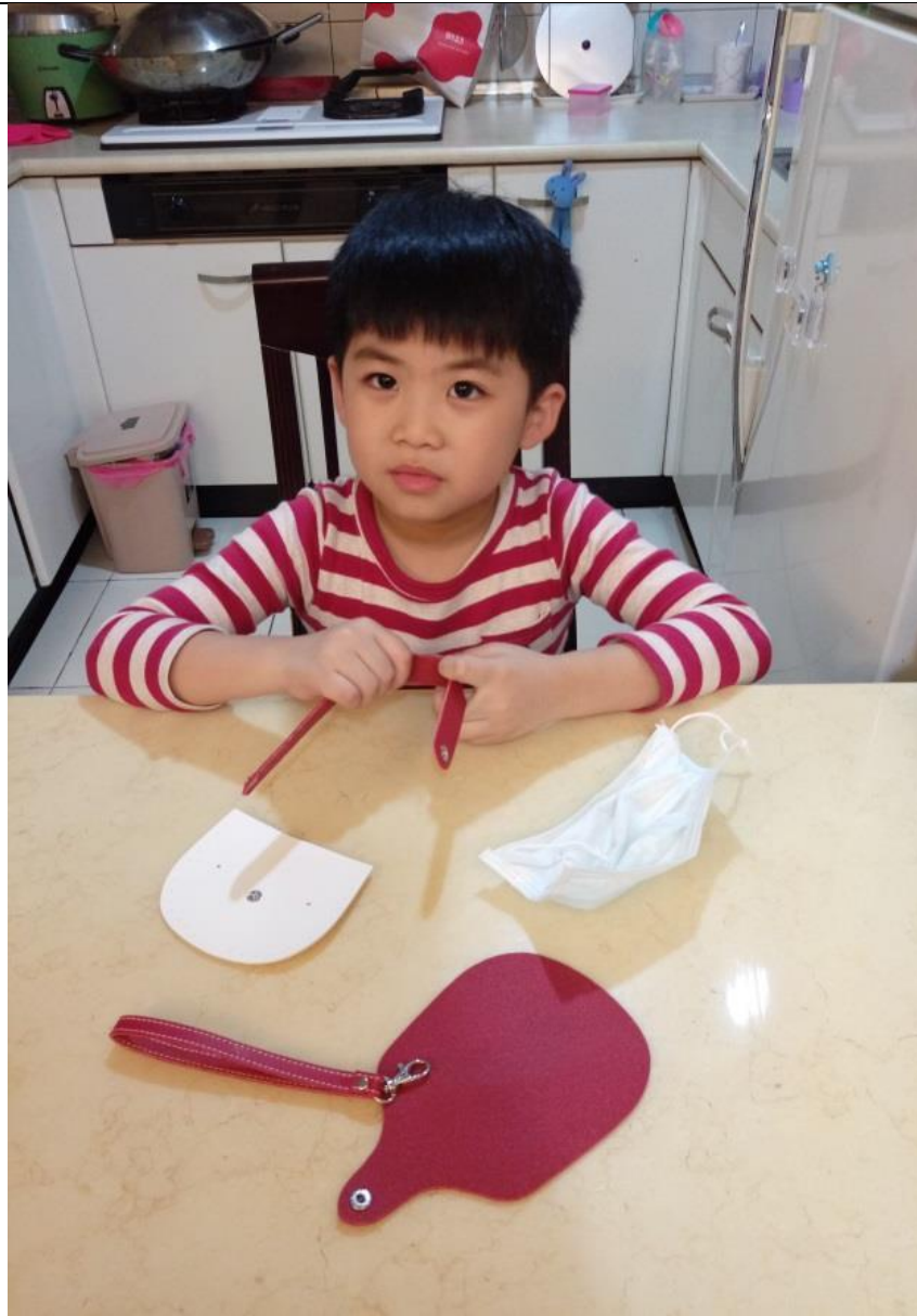
開始動工!努力幫忙中