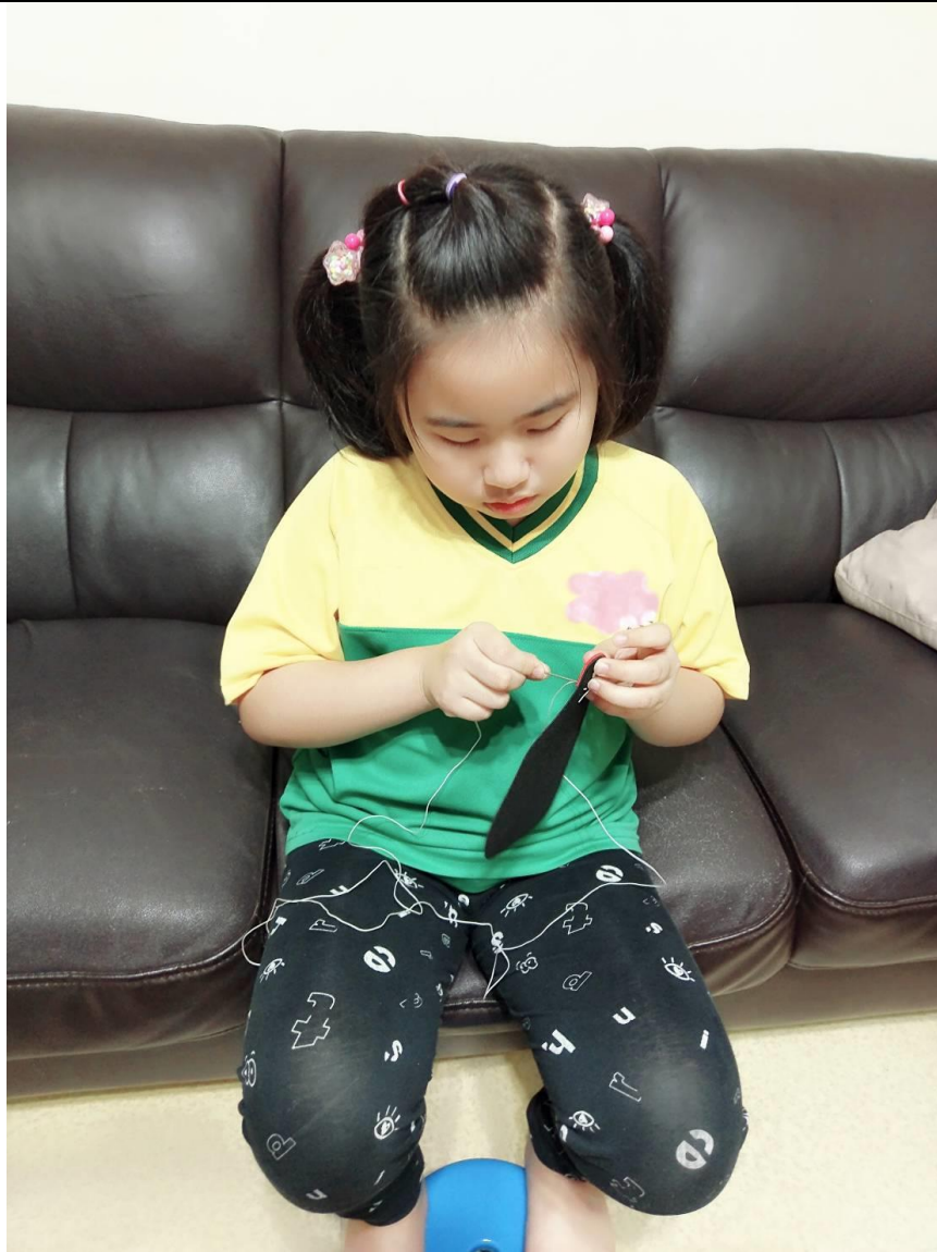
使用棉線仔細的縫合包包