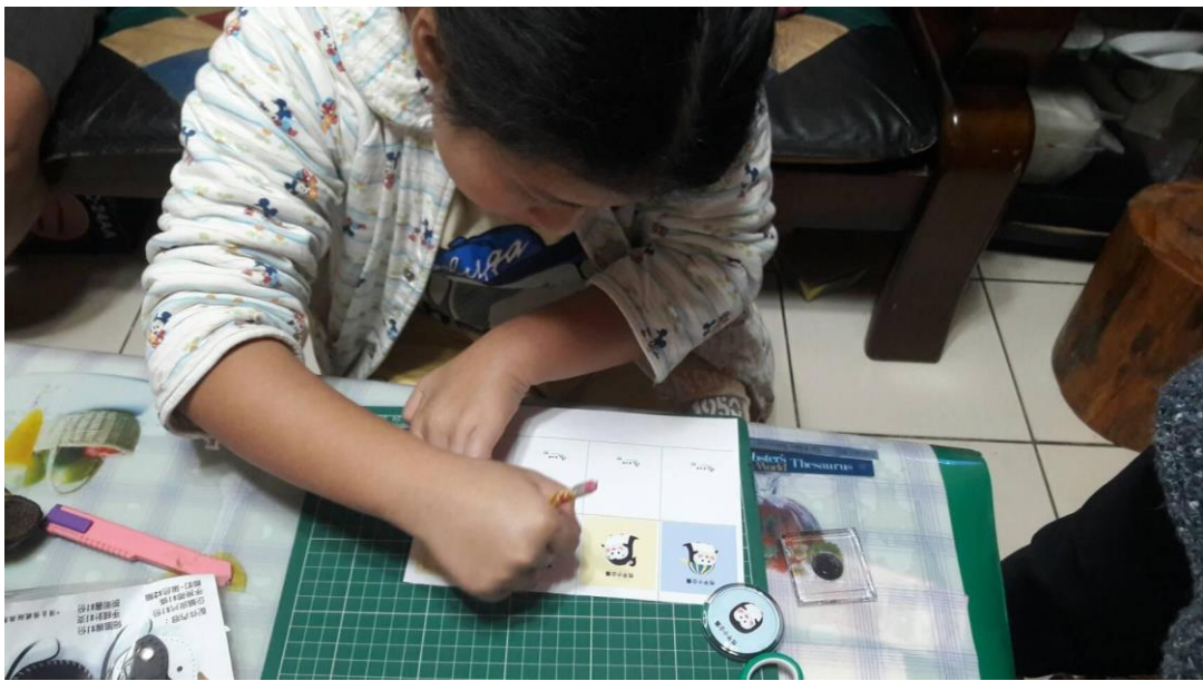
楊妹很認真的描繪，要對準喔！