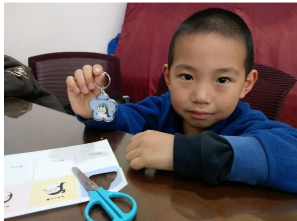
完成好開心，各自掛在自己的書包上當吊飾(梅花這有難唷!!)