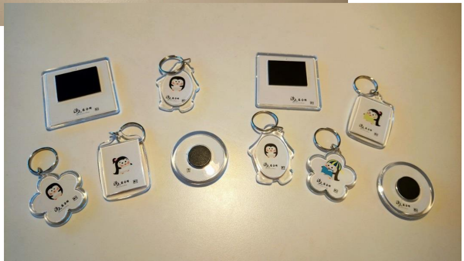
背面就是 公所的 LOGO 囉