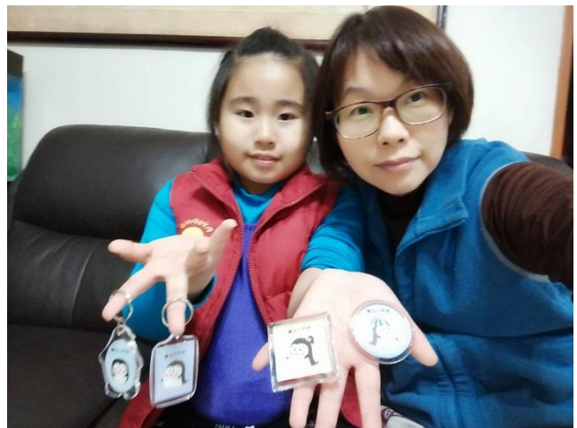
完成美美的壓克力鑰匙圈及磁鐵