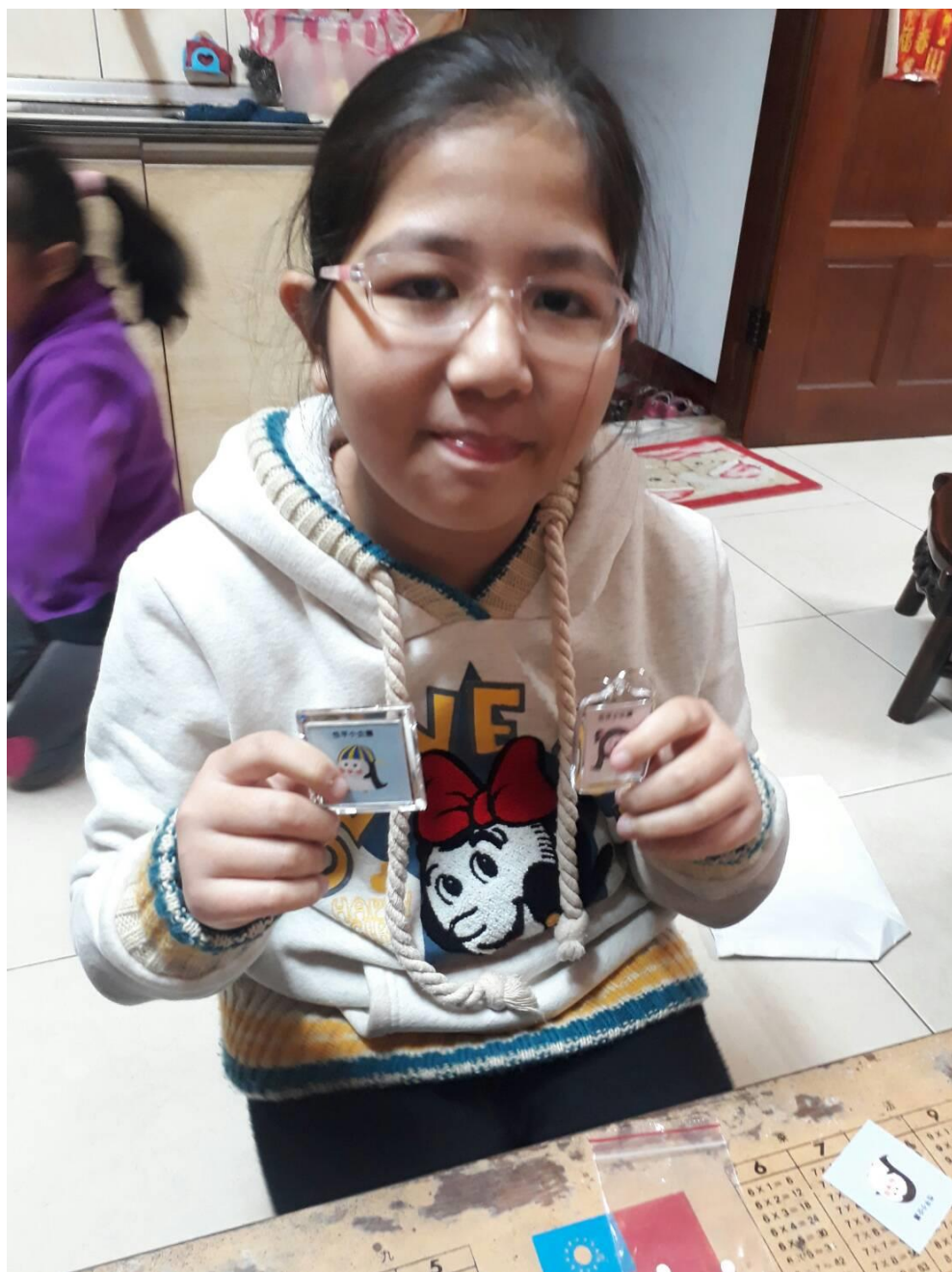
可愛的鑰匙圈跟磁鐵完成囉!!