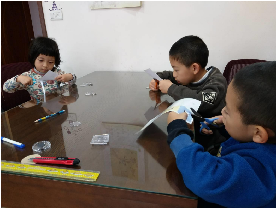
分配吊環，自己選圖，開始剪剪剪