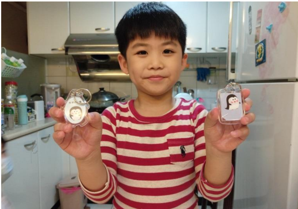
完工!小朋友很開心!