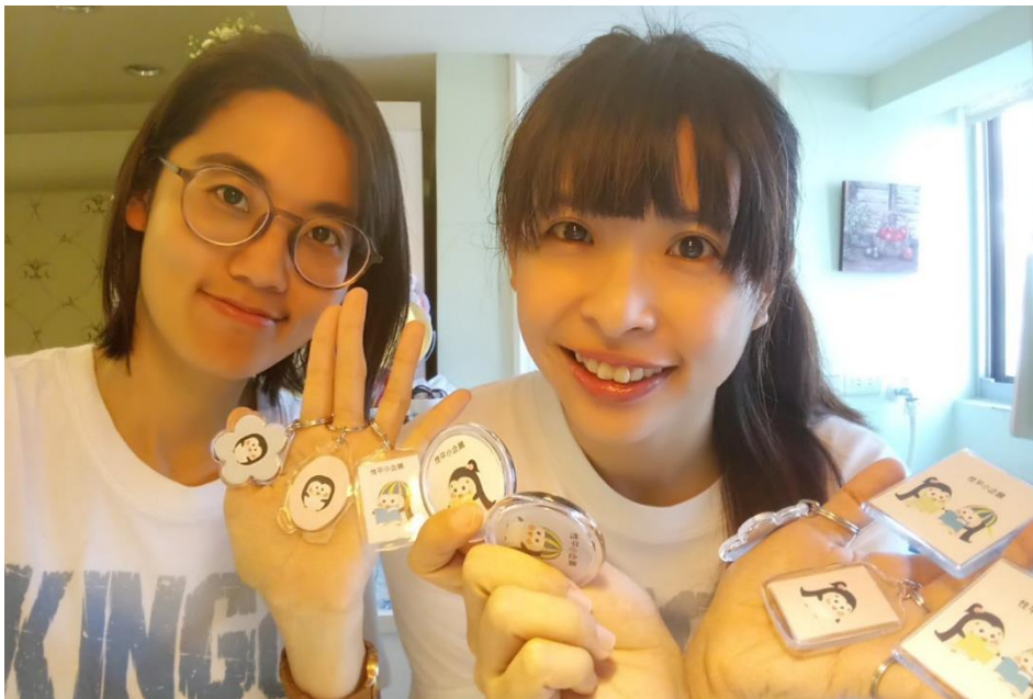
和可愛的 企鵝鑰匙圈們 來個大合照！