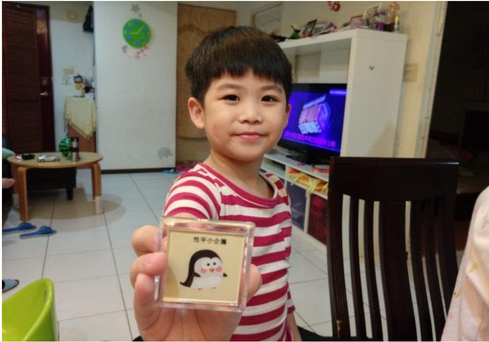
馬上完成壓克力鑰匙圈囉