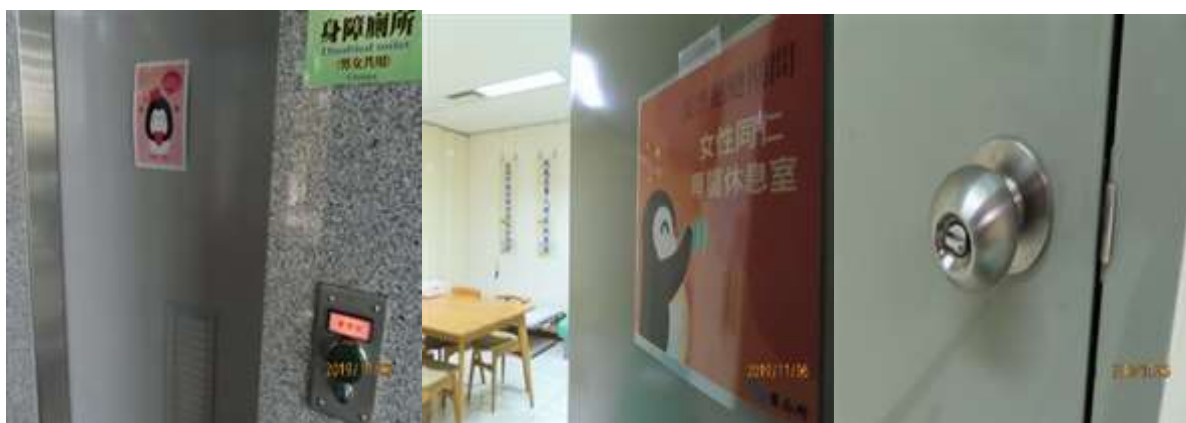
※設立休息室、淋浴間專屬空間標示牌；休息室可上鎖，提高安全性。