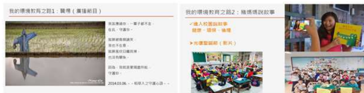
※說明：講座 PPT 畫面(單張)