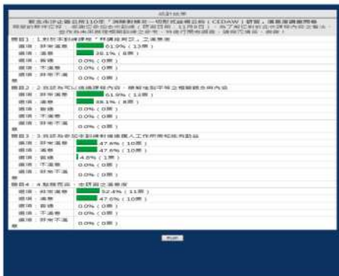
※課後問卷調查滿意度回饋