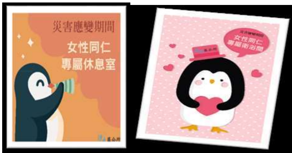
※專屬空間(休息室及衛浴間)標示牌。