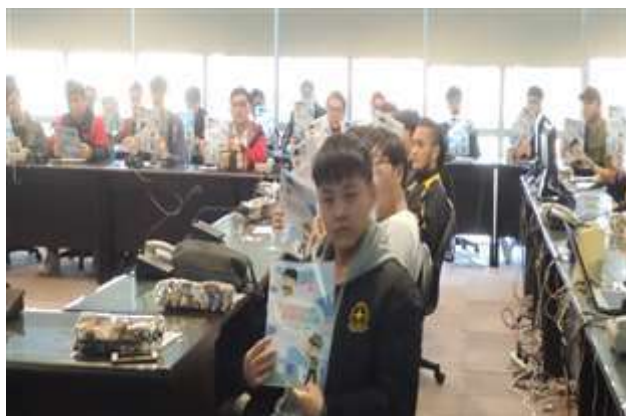
※ 活動照片：藉由相關影片說明性平觀念