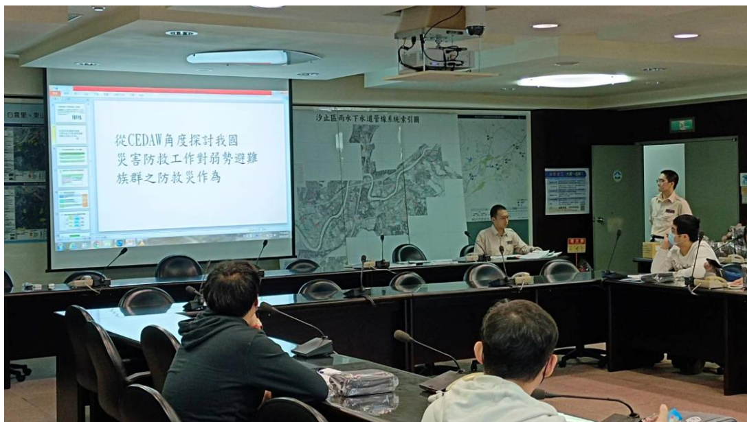
活動說明:宣導從 CEDAW 角度的防救災作為