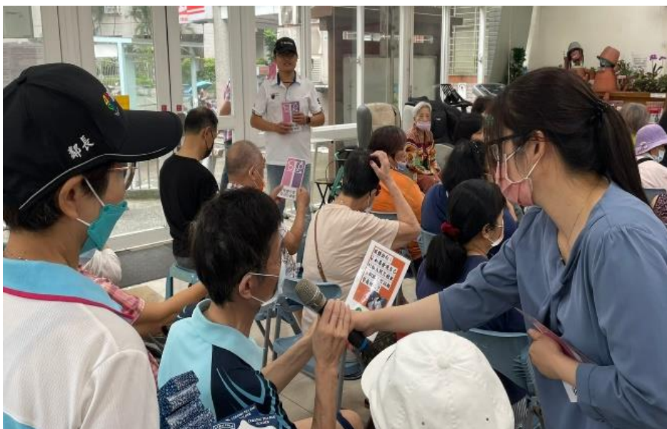
透過性別平等的抽牌卡遊戲與民眾互動