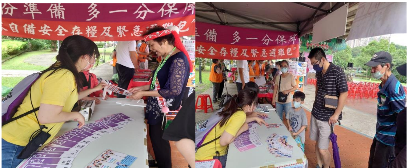
互動遊戲：請民眾抽取性平牌卡，藉民眾的回答，宣導性別平等之內涵