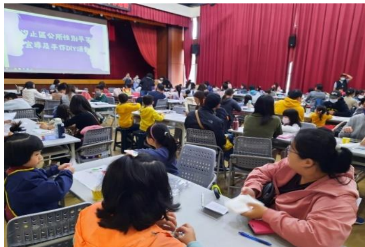
繪本導讀、韓劇性別角色分析講師講解