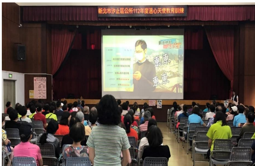
講師與學員分享 Metoo 事件等社會議題