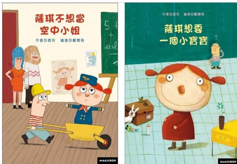
購置性別平等繪本