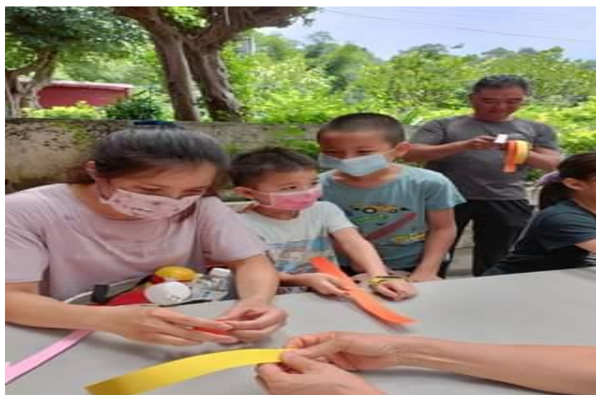
透過DIY的過程，家人之間互相討論、協助，發掘出家庭角色不同的一面