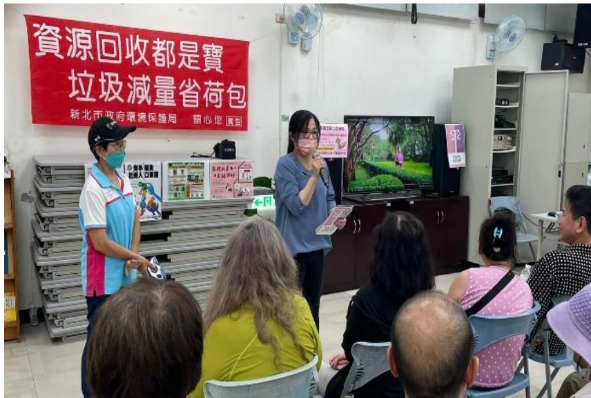
播放新北性平好生活宣導影片