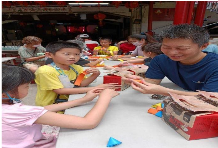
邀請爸爸一同製作粽子造型香包，增進親子關係