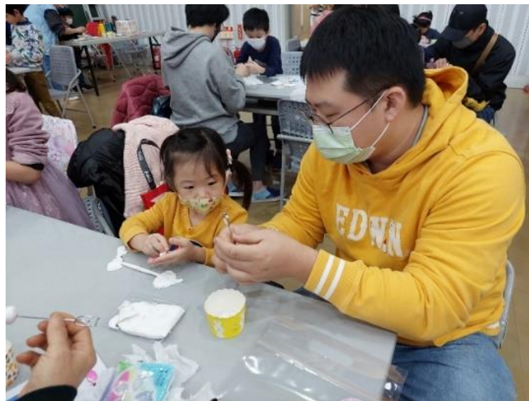
親子一起進行 DIY 手作活動