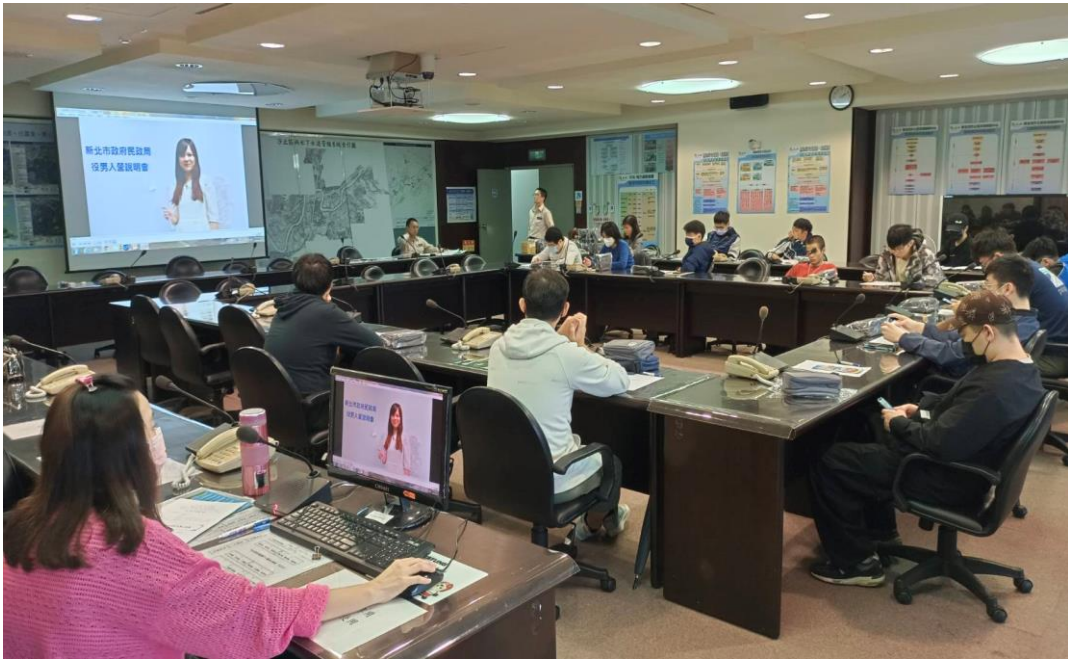
汐止公所透過役男入營說明會宣導性平概念