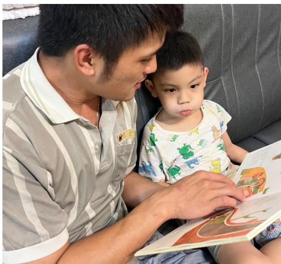
發放性別平等繪本增進親子互動