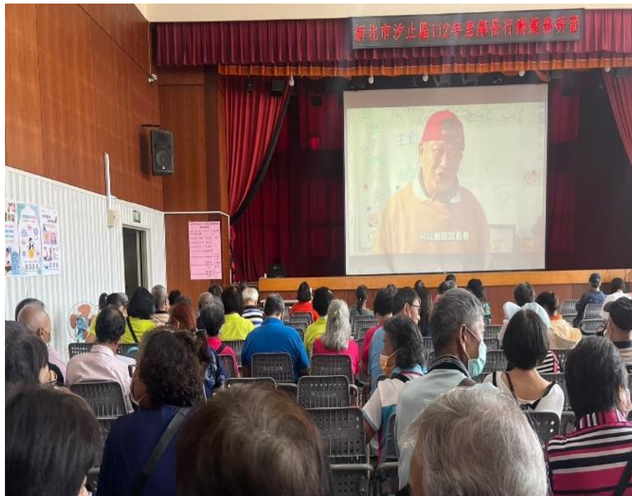
影片以男性擔任里內共餐主廚的實例，宣導性平意識