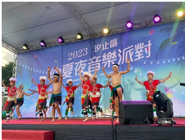
邀請不同文化、性別之表演者進行表演