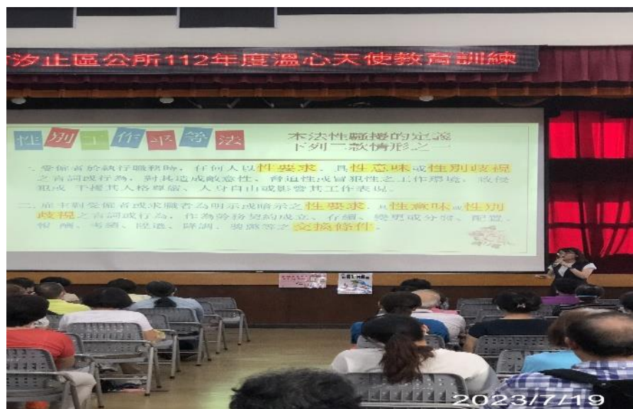
講師說明性別工作平等法內容要點