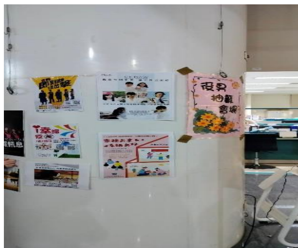
汐止公所於役男抽籤時張貼性平海報的宣導