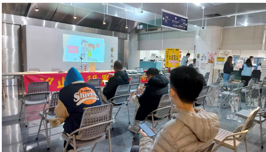
汐止公所於役男抽籤時宣導性平概念的重要性