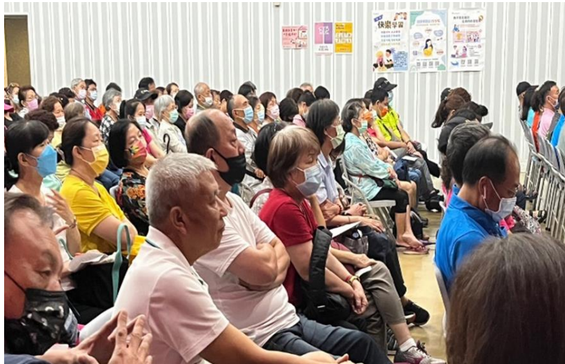
播放新北性平好生活影片宣導及宣導海報張貼，加深鄰長性平意識