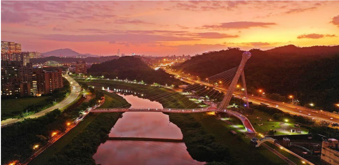
圖一、汐止區星光橋段之暮色景觀