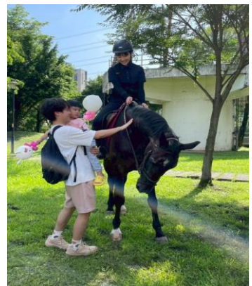
圖八、2025 水返腳逗陣行展演與馬匹互動