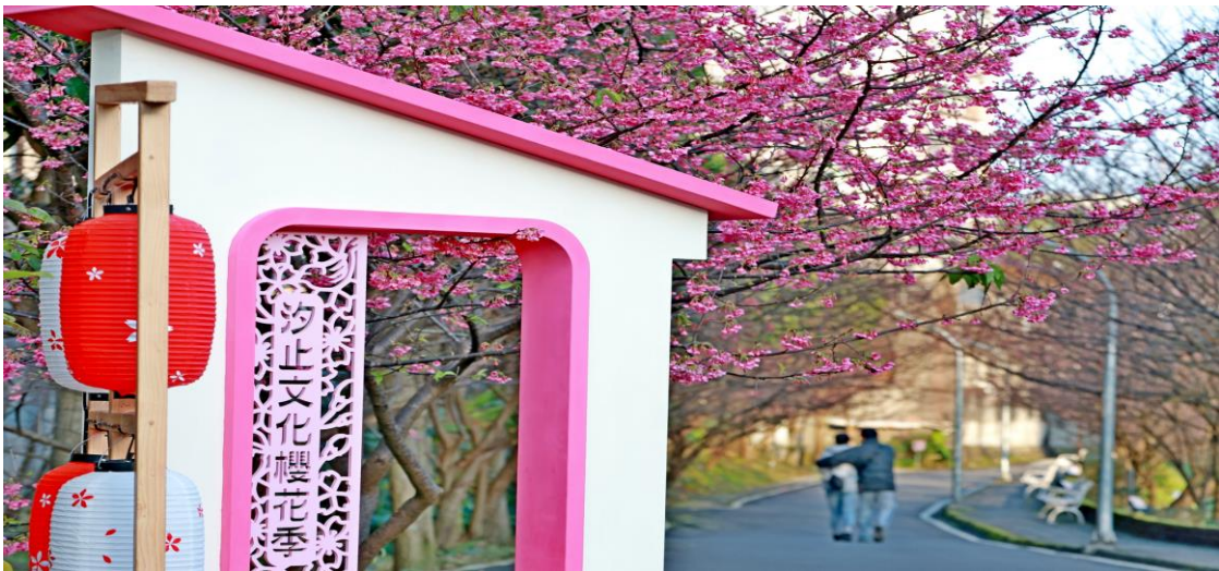
圖十五、汐止區櫻花季「櫻」雨綿綿