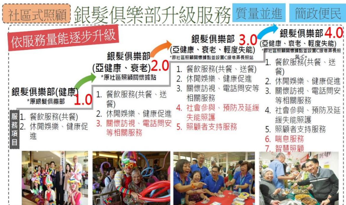
圖十九、汐止區銀髮俱樂部據點的服務項目