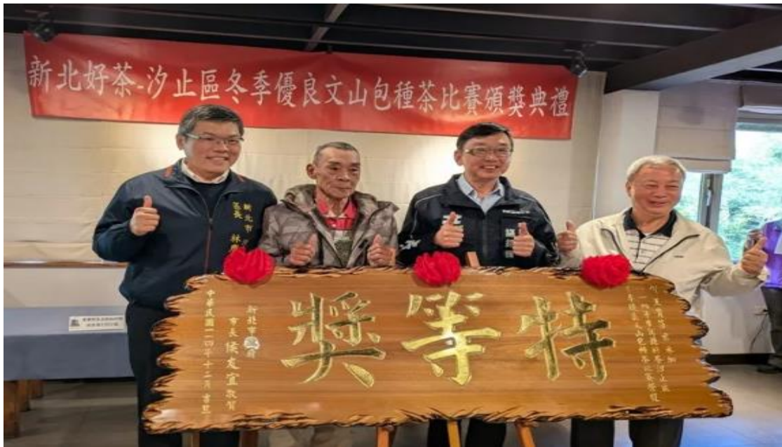
圖十七、114 年汐止區冬茶比賽頒獎典禮