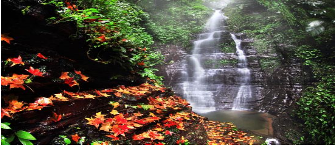
圖十二、秀峰瀑布為大尖山風景區之景點之一