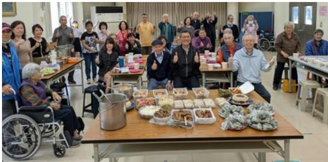
圖十八、老人共餐活動與社區溫暖關懷

在高齡者照護方面，本所提供居家長者送餐、共餐以及銀髮俱樂部據點服務，並整合社區、基金會及民間團體挹注相關資源與服務（共餐活動參見圖十八）。現行銀髮俱樂部依服務能量，逐步由 1.0 升級至 4.0，內容涵蓋餐飲、健康促進、關懷訪視、延緩失能及智慧照顧等項目（據點服務項目詳見圖十九），完善高齡者社區照護服務網絡，並促進居民身心健康。