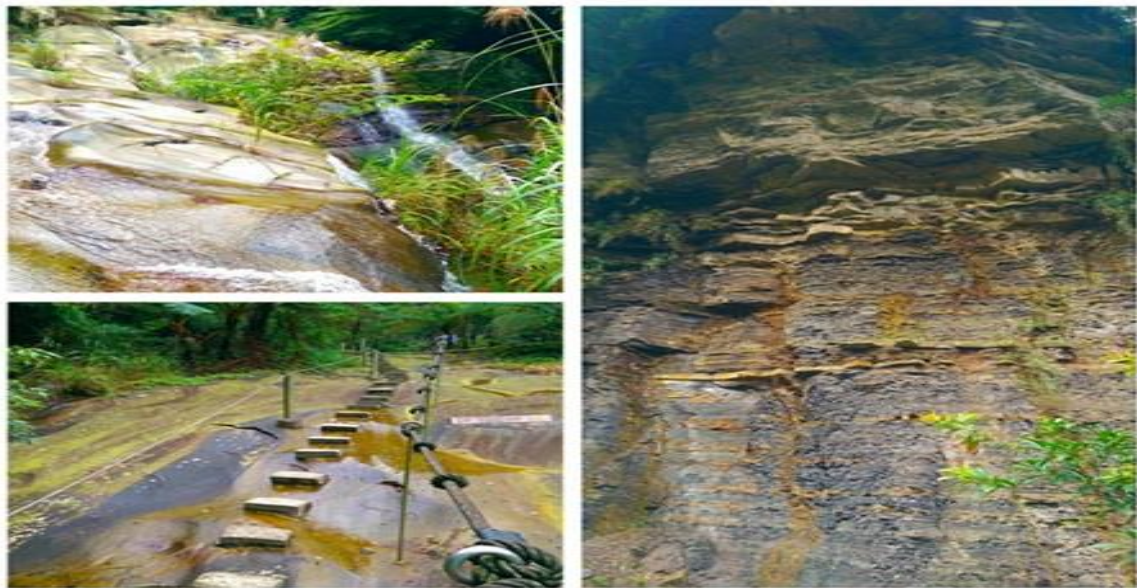
圖十一、汐止姜子寮展望臺及絕壁景觀