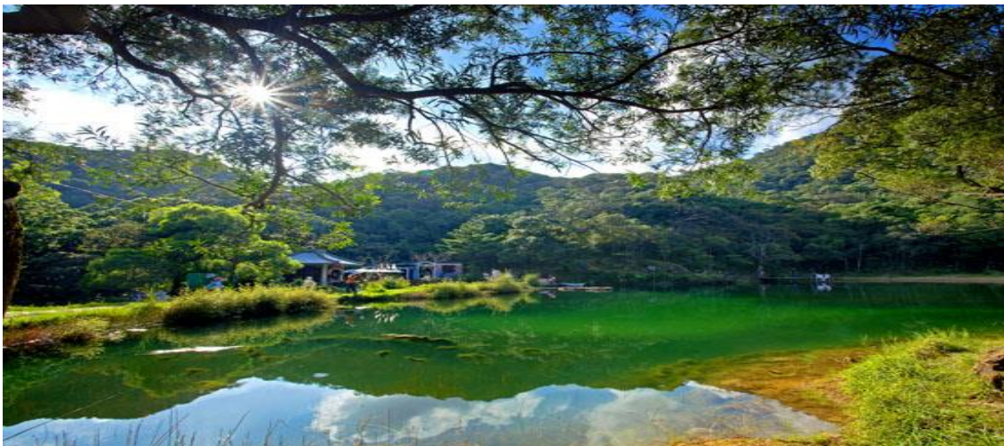
圖十三、新山夢湖又稱為「天使的秘境」