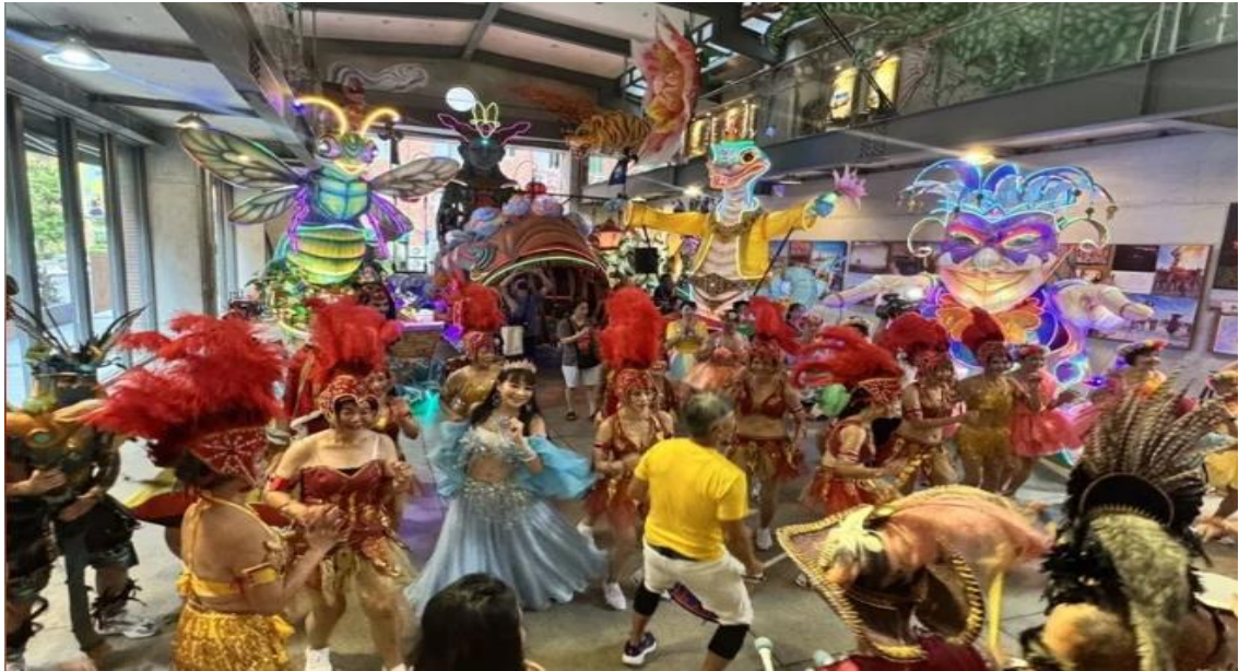
圖十、2025 夢想嘉年華以「變。CHANGE」為主題