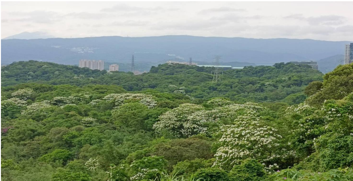
圖二、五月汐碇路油桐花遍野盛開