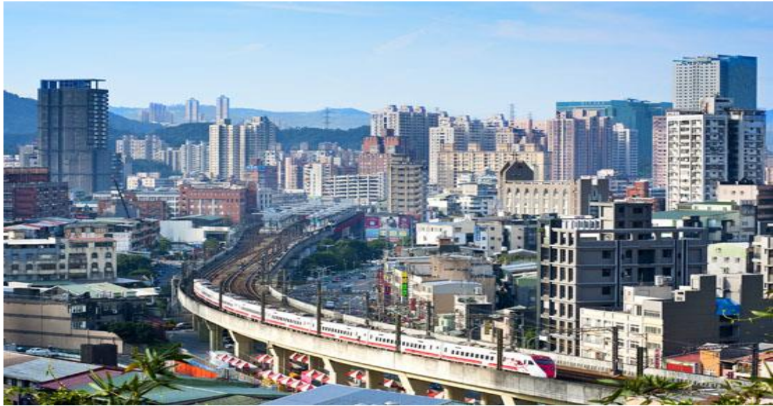
圖四、汐止區之交通要道發達，為新興的科技城