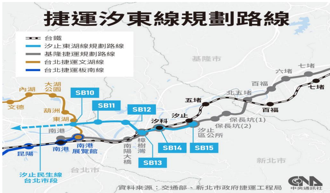
圖六、捷運汐東線(原汐止民生線)規劃路線圖