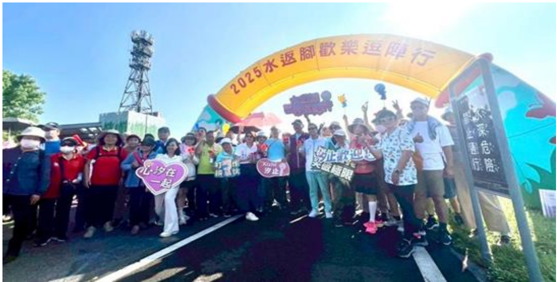
圖七、2025 水返腳逗陣行戶外活動