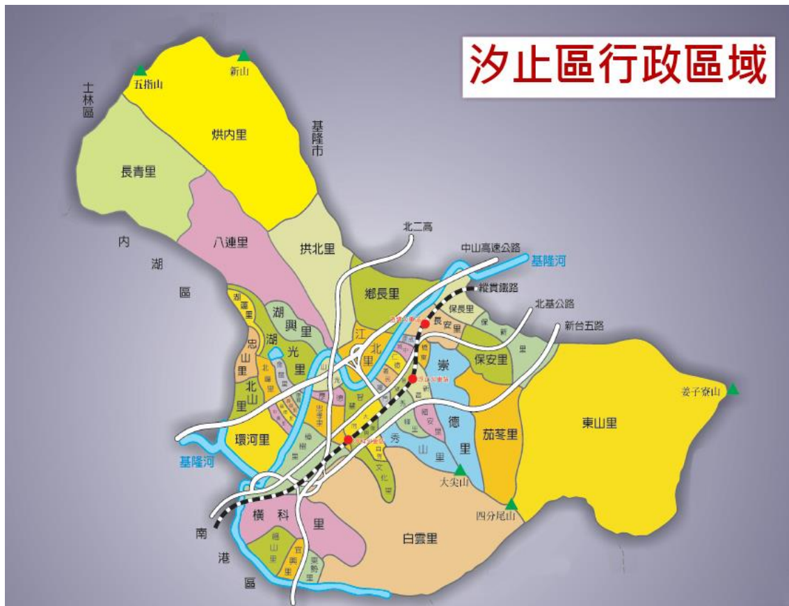
圖三、汐止區行政區域圖