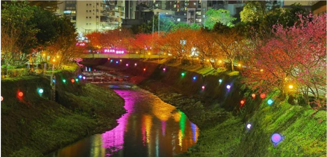
圖十四、康誥坑溪櫻花廊道美不勝收