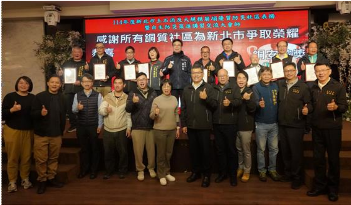
圖二十、114 年新北市優質防災社區表揚合影