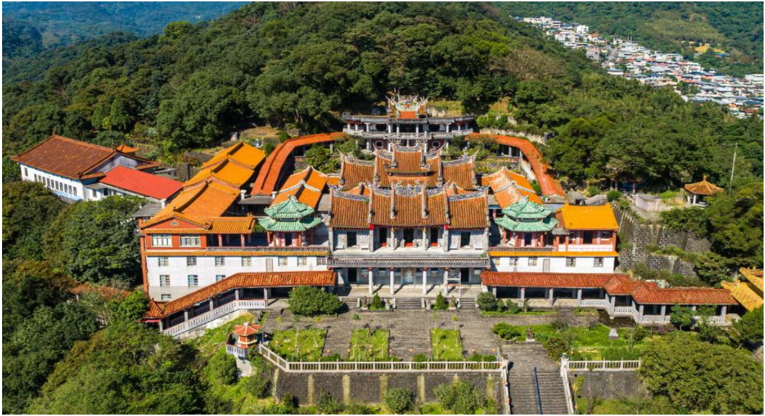
圖十六、汐止拱北殿之名勝景觀