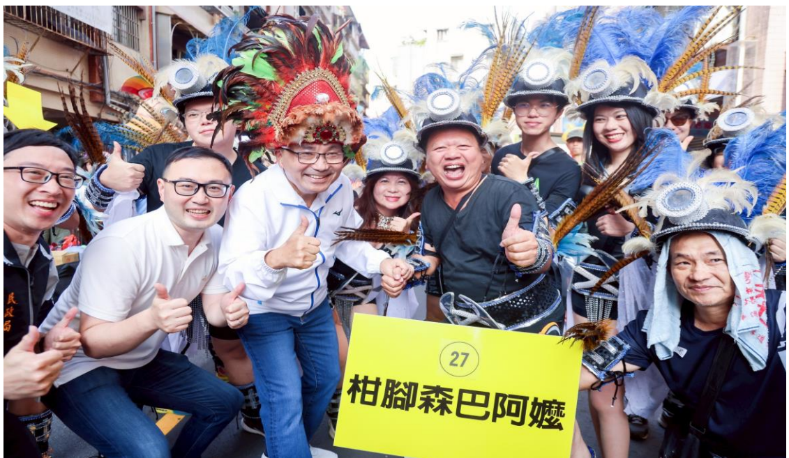
圖九、2025 年夢想嘉年華踩街遊行活動