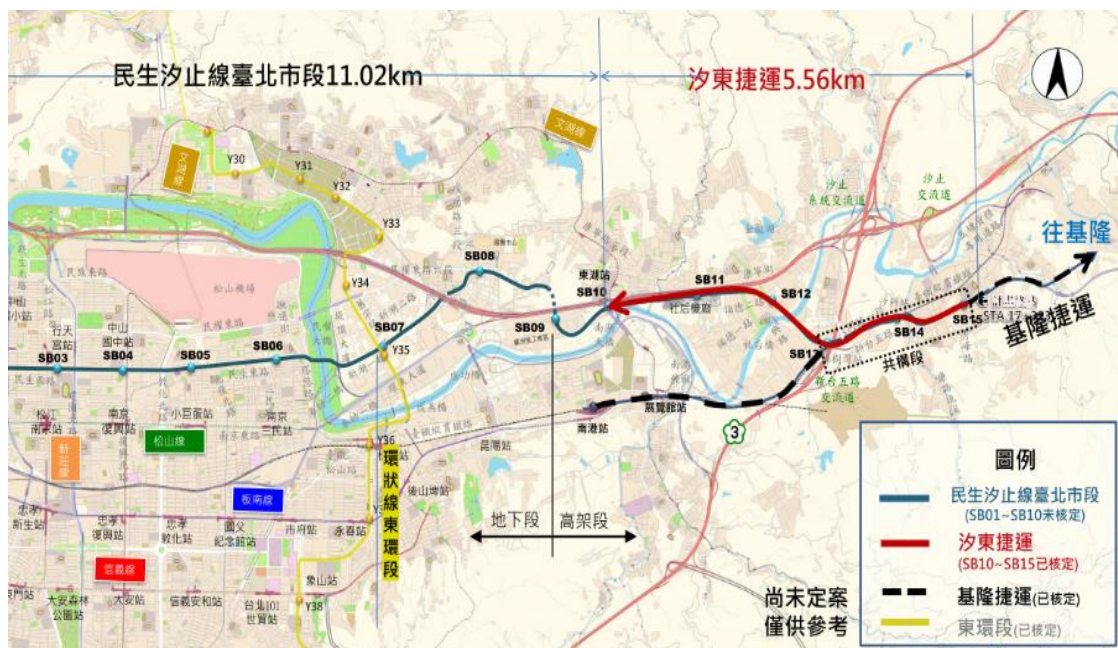
圖五、臺北捷運「民生汐止線」路線示意圖

在現代大眾捷運系統方面，「捷運汐東線」於113年底已完成工程簽約，並於114年3月20日正式動工。目前工程進度穩定，同興路段已陸續展開基樁施作與圍籬架設，全線預計於121年4月完工。未來汐東線將在汐止區設置6座高架車站，並於汐科站與臺鐵、基隆捷運共站銜接，形成三鐵共構的轉乘節點；在長遠規劃上，該路線亦將與臺北市端之民生線串聯，構成完整的「民生汐止線」軌道網絡（整體路線規劃及轉乘系統詳見圖五、圖六），將有助於縮短居民區域通勤時間，增進公共運輸便利性。