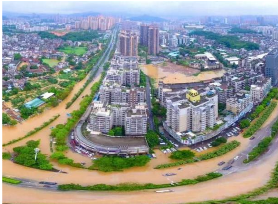
艾維尼颱風之暴雨造成當地淹水嚴重