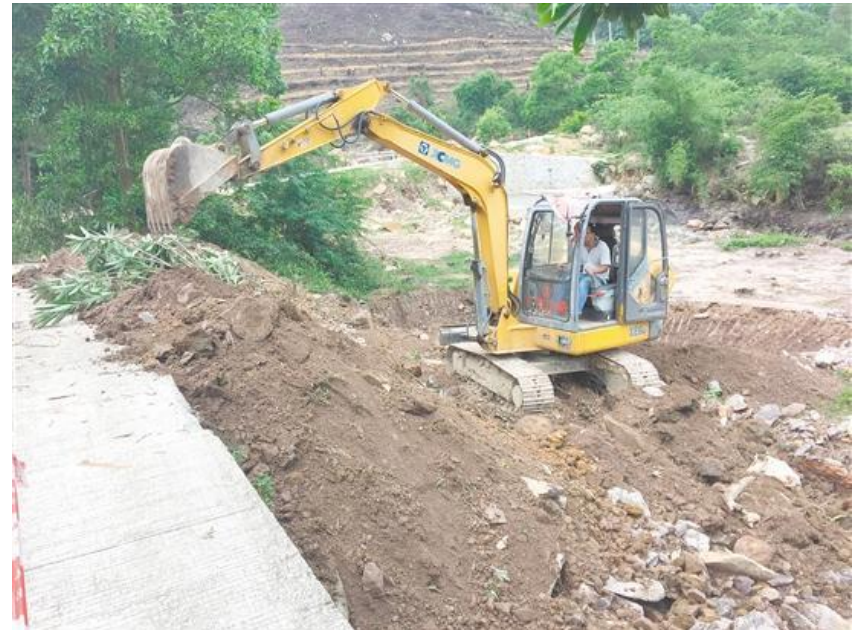
針對公路進行清障