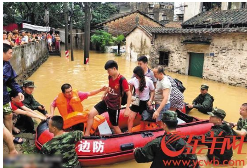
當地政府協助搶救受災民眾及運送考生