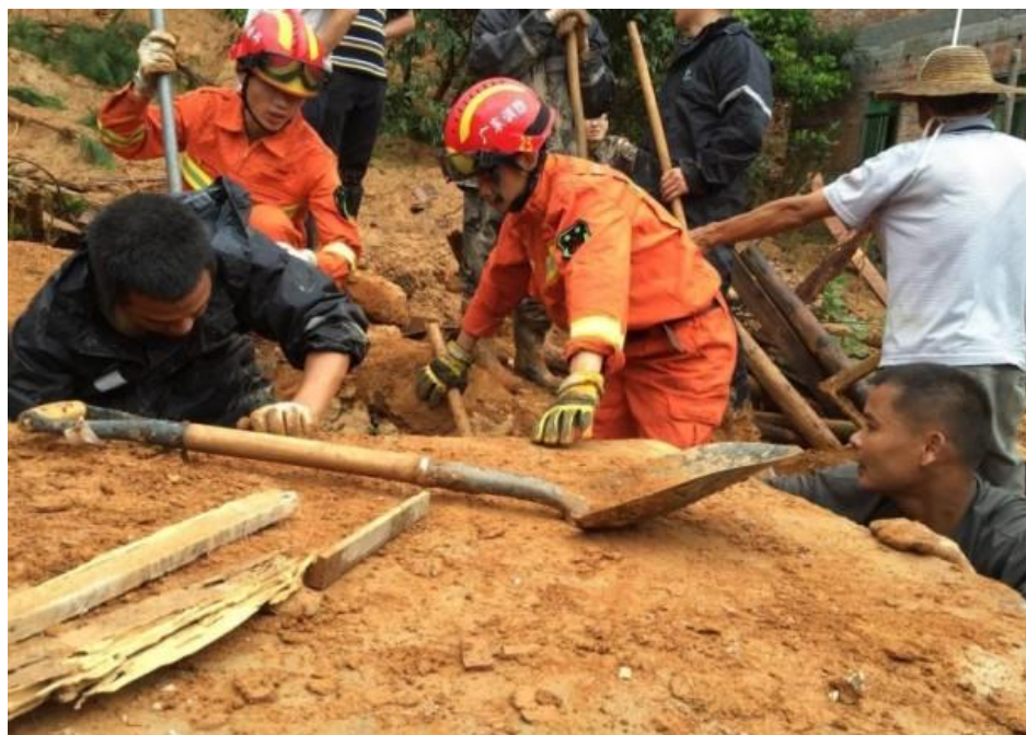
搜救人員於土石中搜尋被埋者