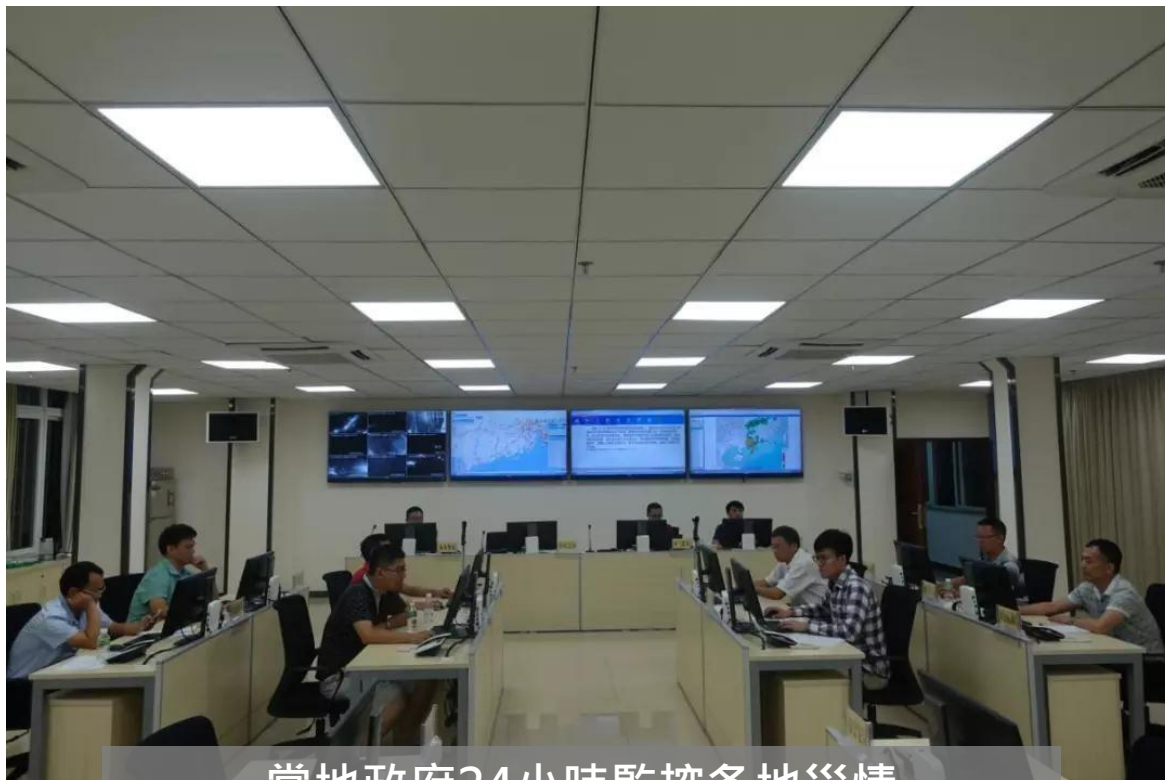
當地政府24小時監控各地災情