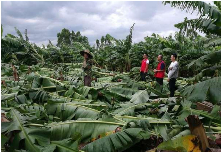
災後勘查各地災情

當地政府於災後 立即召開救災復原工作會議 ，成立工作小組，指導各地展開各項復原工作，共計開放3277處避難收容處所，安置8194人，並 盡速處理各地基礎設施之搶修 ，以立即恢復正常生活。