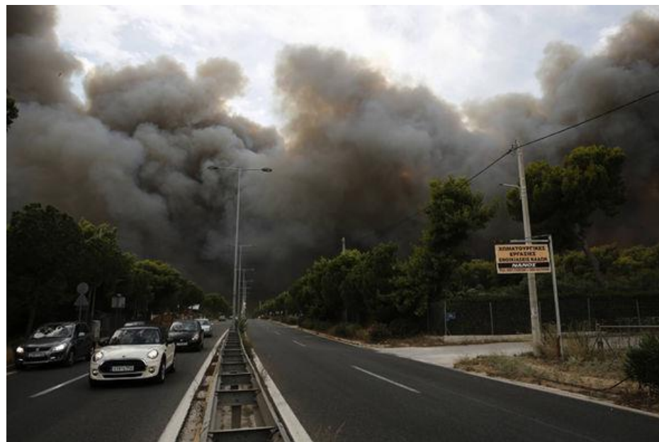
大量濃煙影響當地交通