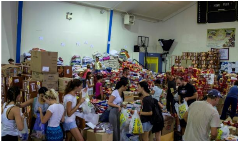
各式物資及醫療必需品提供災民使用