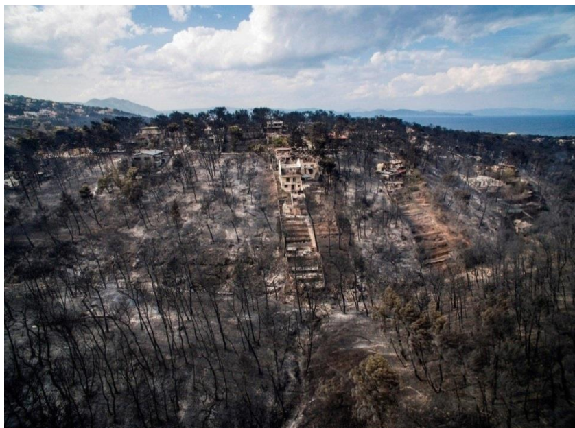
慘遭野火侵襲後的馬諦村