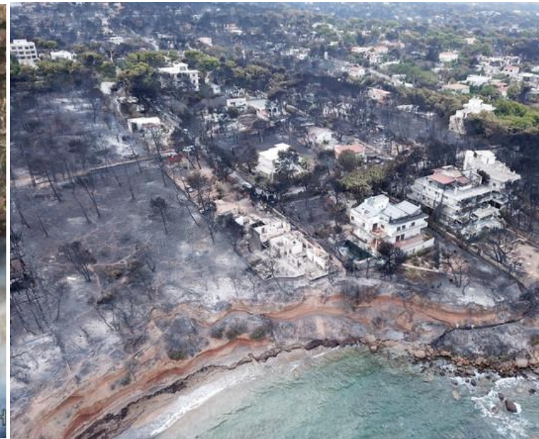
希臘野火延燒災情