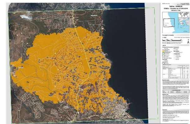
馬諦村遭野火侵襲區域(黃色部分)