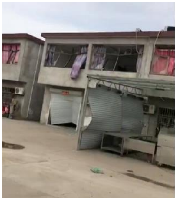
附近住宅窗戶全被震碎

根據中國應急管理部的資料，嘉宜化工廠曾被中國安監部門通報 13項安全隱憂 ，其中「 負責人未經安全管理和管理能力考核合格 」、「 特殊儀表作業人員只有1人取得證照 」、化工廠重大危險來源的 苯罐與甲醇罐區 ，「 都未設置罐根部緊急切斷閥 」、「 苯、甲醇裝卸現場無防洩漏應急措施 」等，皆成為這次爆炸的根本原因。