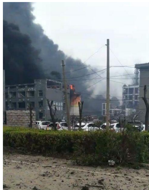
爆炸現場濃煙竄升