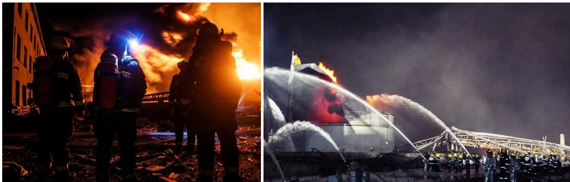
救災人員全力搶救火勢