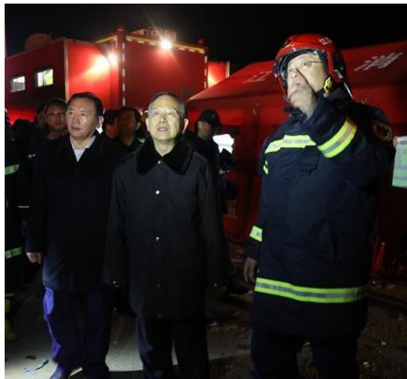
應急管理部前往指導處置工作