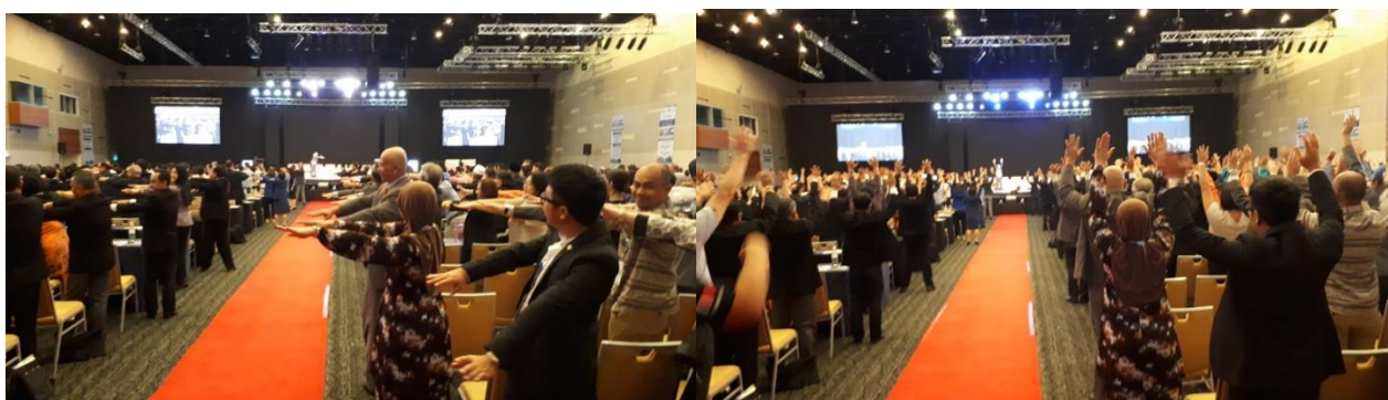
(大會漏網鏡頭：大會開幕前全體與會人員一起做運動啲！)