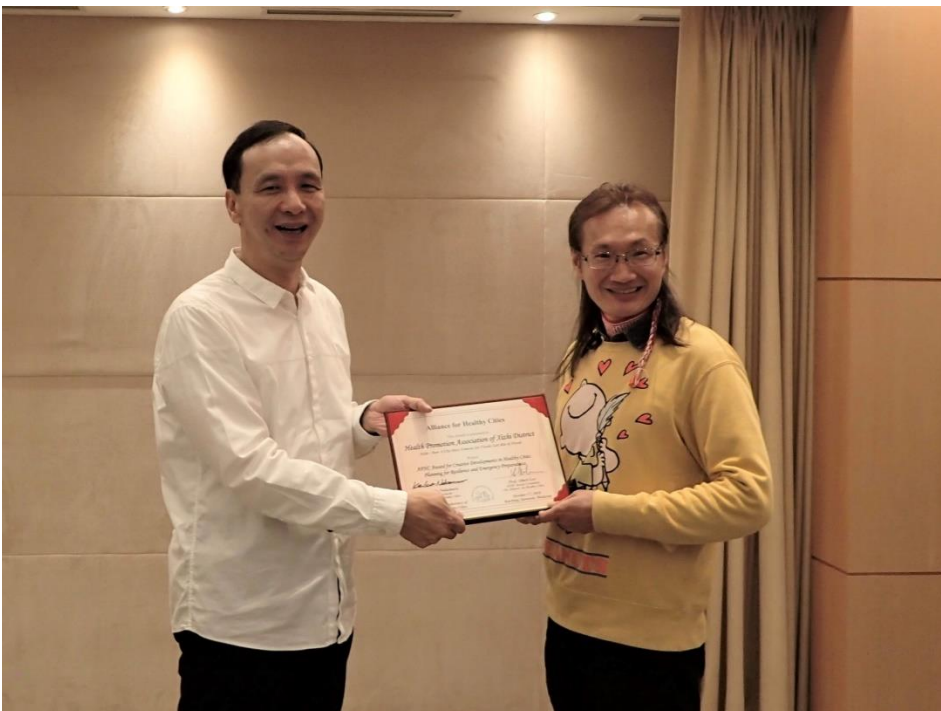
2018 年 10 月 30 日帶著獎狀與新北市市長合影

謝天謝地謝謝很多人,我擅於圖文並茂的書寫,以兩三段落文字搭配一張照片的寫作方式,可能頗受國際評審青睞。尤其我以災害防救為主題,撰寫颱風水災的整備、救援與復原機制,在醫療健康與公共衛生領域為主軸的健康城市聯盟要脫穎而出,也著實非易。