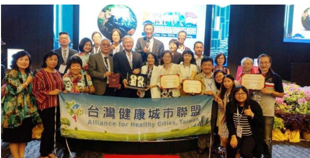
↑（此行臺灣團代表與世界衛生組織亞太總部的主任等進行合影）